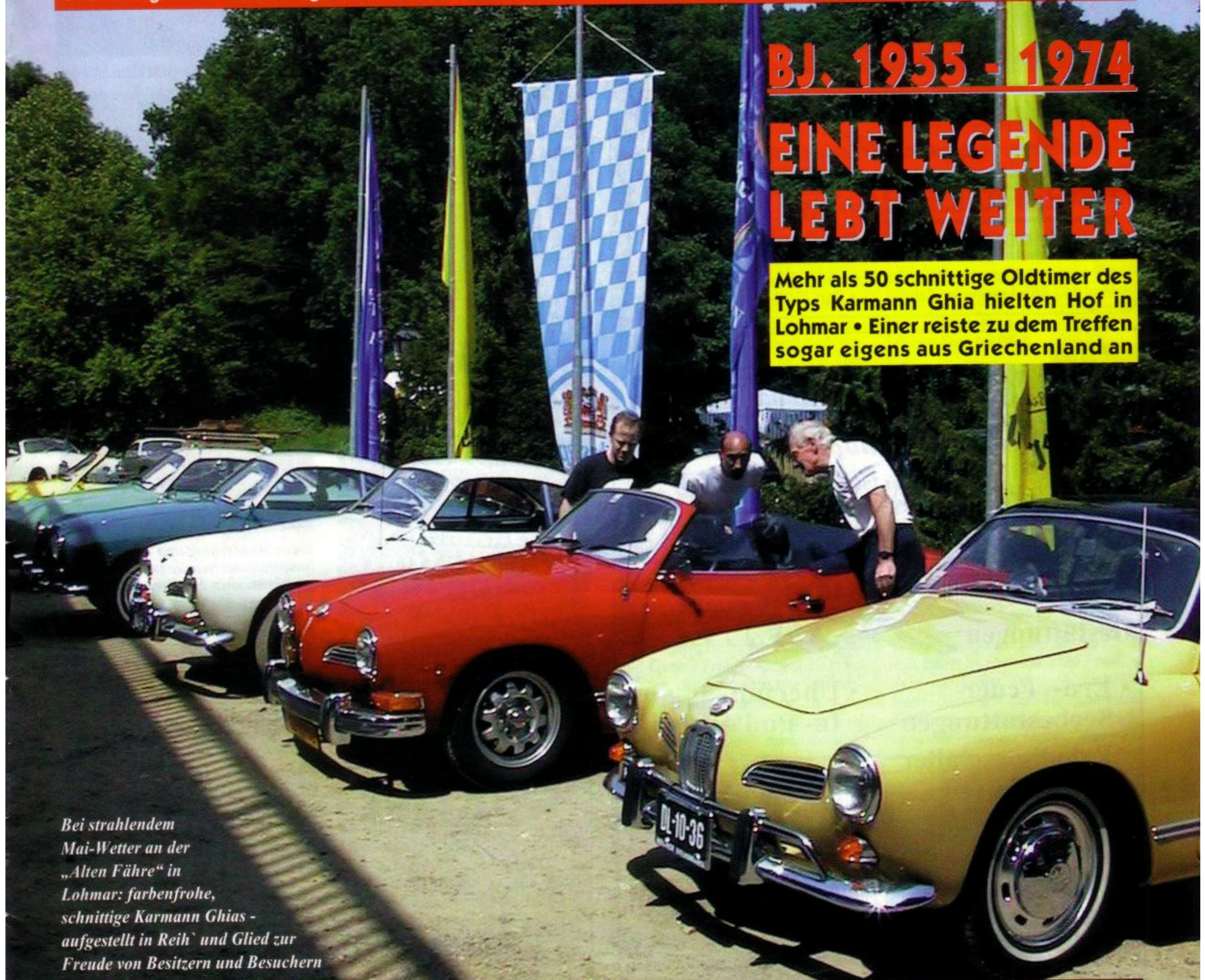
Bei strahlendem Mai-Wetter an der „Alten Fähre“ in Lohmar: farbenfrohe, schnittige Karmann Ghias - aufgestellt in Reih` und Glied zur Freude von Besitzern und Besuchern

Mehr als 50 schnittige Oldtimer des Typs Karmann Ghia hielten Hof in Lohmar • Einer reiste zu dem Treffen sogar eigens aus Griechenland an